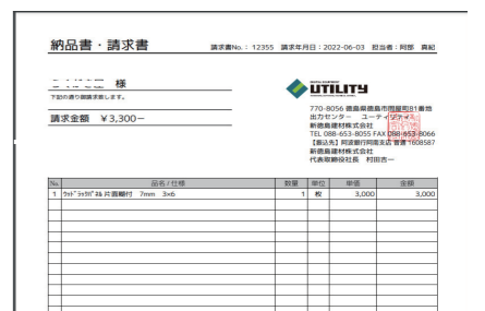
納品書・請求書作成 売上処理後納品書・請求書を発行します。