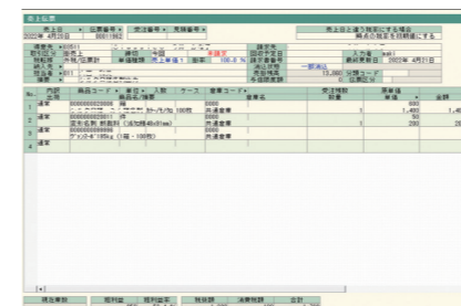
売上伝票 ①で入力したデータをインポートするだけです。