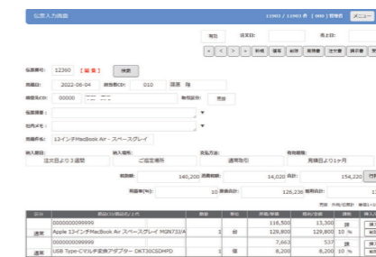
伝票入力画面 顧客・商品を登録し、価格等を入力します。