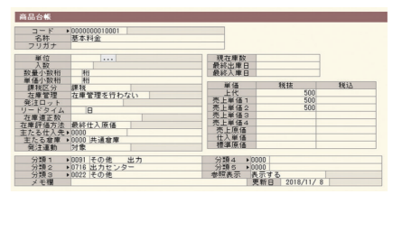
商品登録 ①の入力用に登録を行い、アップロードします。