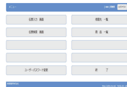
トップページ 通常の業務はブラウザで行います。